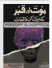
Maut Aur Gabar K Halra Kun Waqiat Urdu Book Download