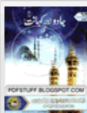
Jadu Aur Kahanat Ki Hastiyat Pdf Urdu Book Download