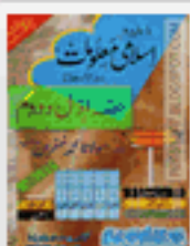
Zakheera Islami Malumat Sarvan Janaban Pdf Download