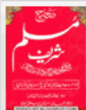
Sahih Muslim in Urdu All Volumes 16 Pdf Free Download