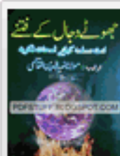
Jhotay Dajal KR Inay Book by Dja Uddin Free Download