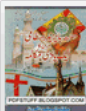
Hazrat Ba-Yazeed Bastami Aur Qun Ka Ek Padri Se Mukalima