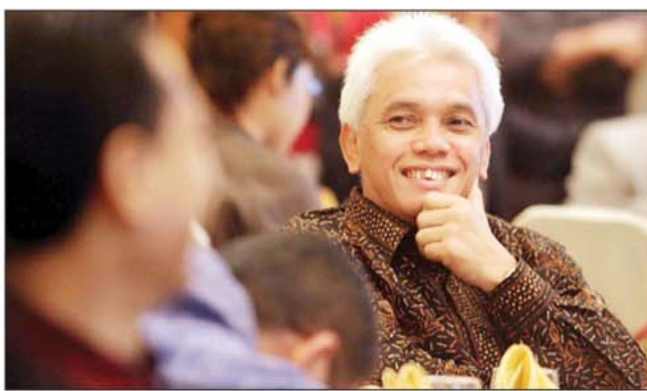
STABIL: Menko Perekonomian Hatta Rajasa dalam sebuah kesempatan. Perekonomian Indonesia dianggap tetap stabil dan meski sisa-sisa krisis masih menghantui sejumlah negara.

Menurut Hatta, pemerintah tidak akan menyeragamkan insentif pa-