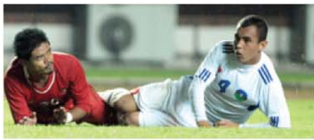
KRIS SAMIAH/SUMATERA EKSPRES/SPN

TOTAL SPORT Koleksi Medali Tak Bertambah Kontingen Indonesia Turun ke Peringkat Ke-12