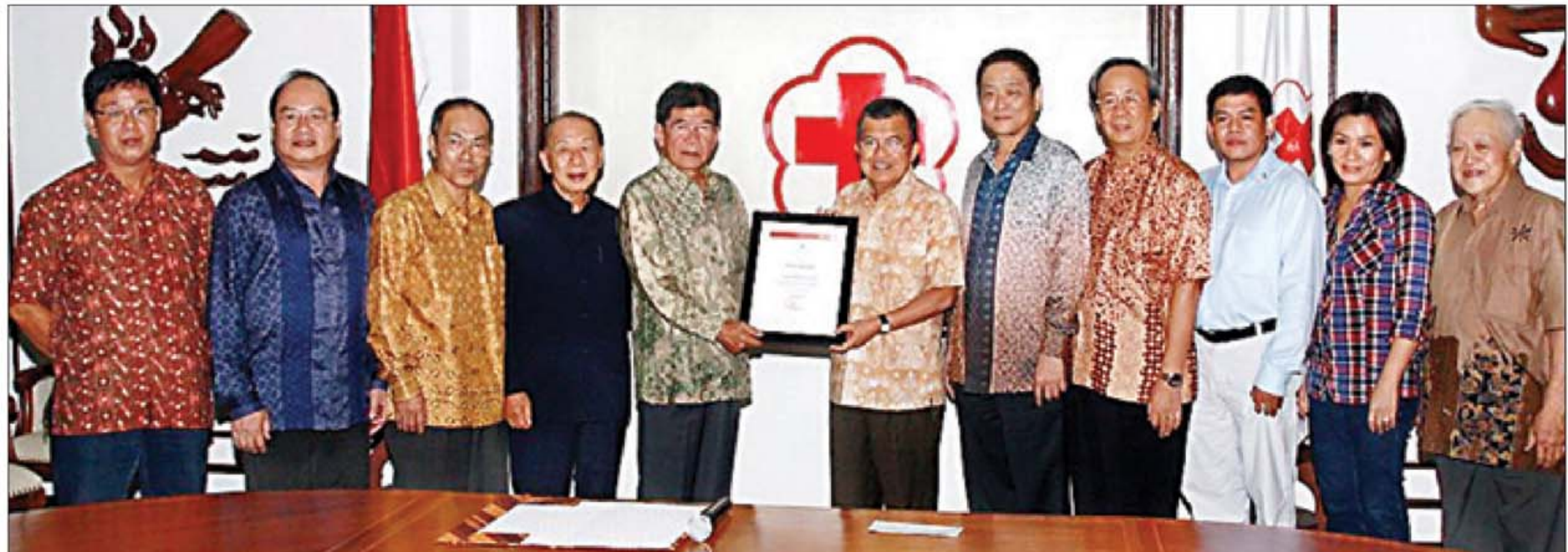
PEDULI: Perwakilan pengurus Yayasan Bumi Khatulistiwa menyerahkan dana bantuan bencana kepada PMI. Mereka diterima langsung Ketua PMI Pusat Jusuf Kalla, Jumat (19/11) lalu.