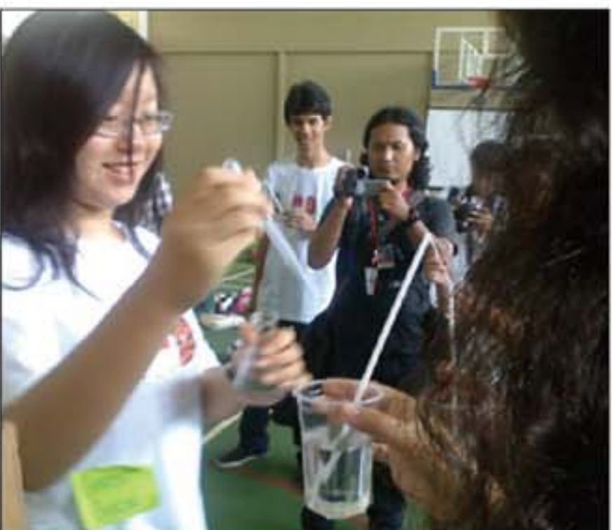
BERBAGI: Peserta memindahkan air dengan sedotan.