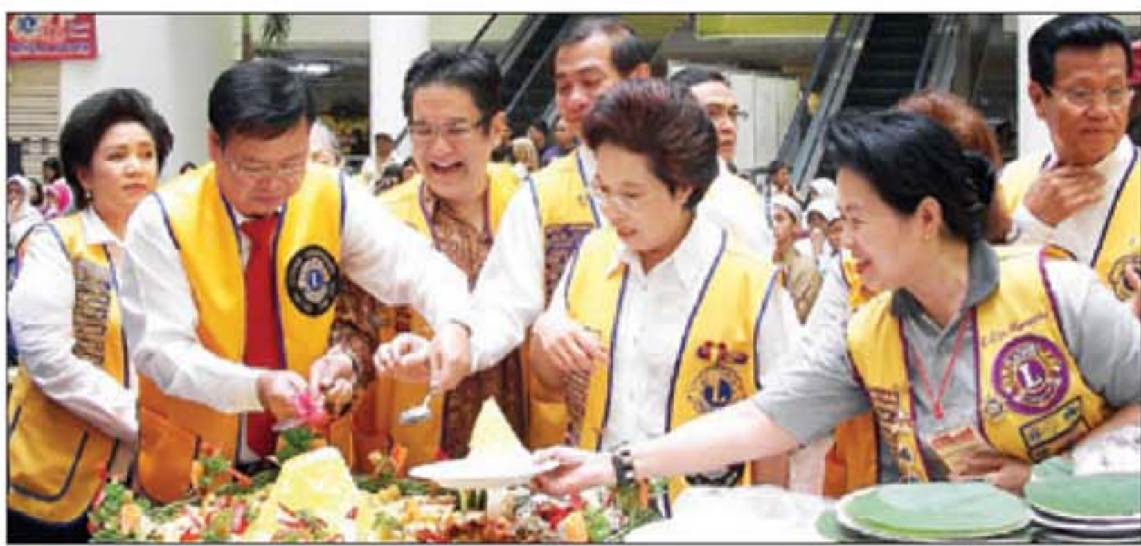
POTONG TUMPENG: Perayaan HUT ke-41 Lions Club Indonesia di pusat grosir Blok B Tanah Abang, Jakarta, Sabtu (20/11) lalu.