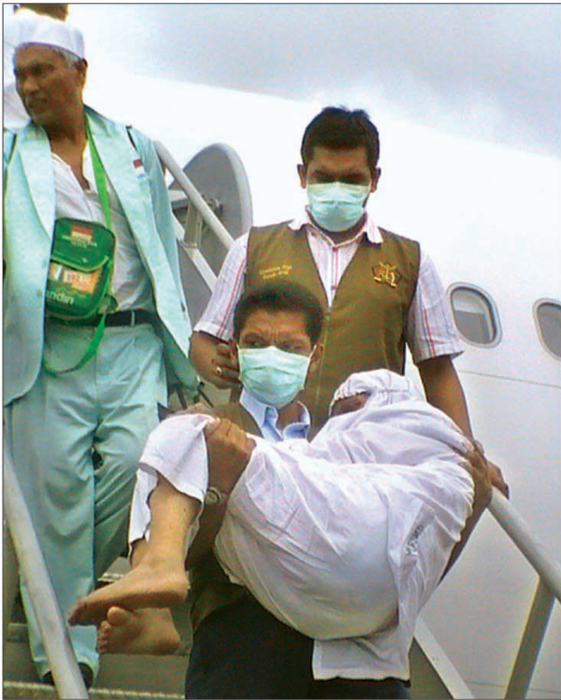
LANSIA: Petugas membopong lansia yang baru tiba di Bandara Internasional Sultan Iskandar Muda Aceh.

Yang ditangkap, lantas dilumpuhkan di tanah ini memang seorang demonstran yang memprotes KTT NATO di Lisbon, Portugal. Dia berbandan ala badut, menyindir pertemuan para kepala negara yang tak ubahnya pertunjukan komedi. Sejumlah media memang melansir bahwa demonstran yang berbandan ala badut itu memang benar-benar membadut. Mereka menari-nari dan bertingkah konyol di hadapan petugas keamanan. Para polisi tersebut bukan tak punya rasa humor. Tetapi, membadut di tepi jalan, di tengah-tengah pertemuan penting, memang mengganggu. Maka, (bisa jadi sambil menahan tawa) polisi itu beraksi menangkap para badut jalanan tersebut. (*)