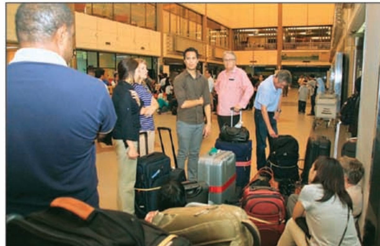
TELANTAR: Beberapa WNA penumpang Garuda tujuan Jakarta di Bandara Hang Nadim Batam, kemarin sore.