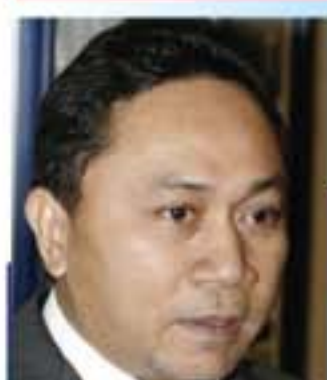
Zulkifli Hasan, Menteri Kehutanan