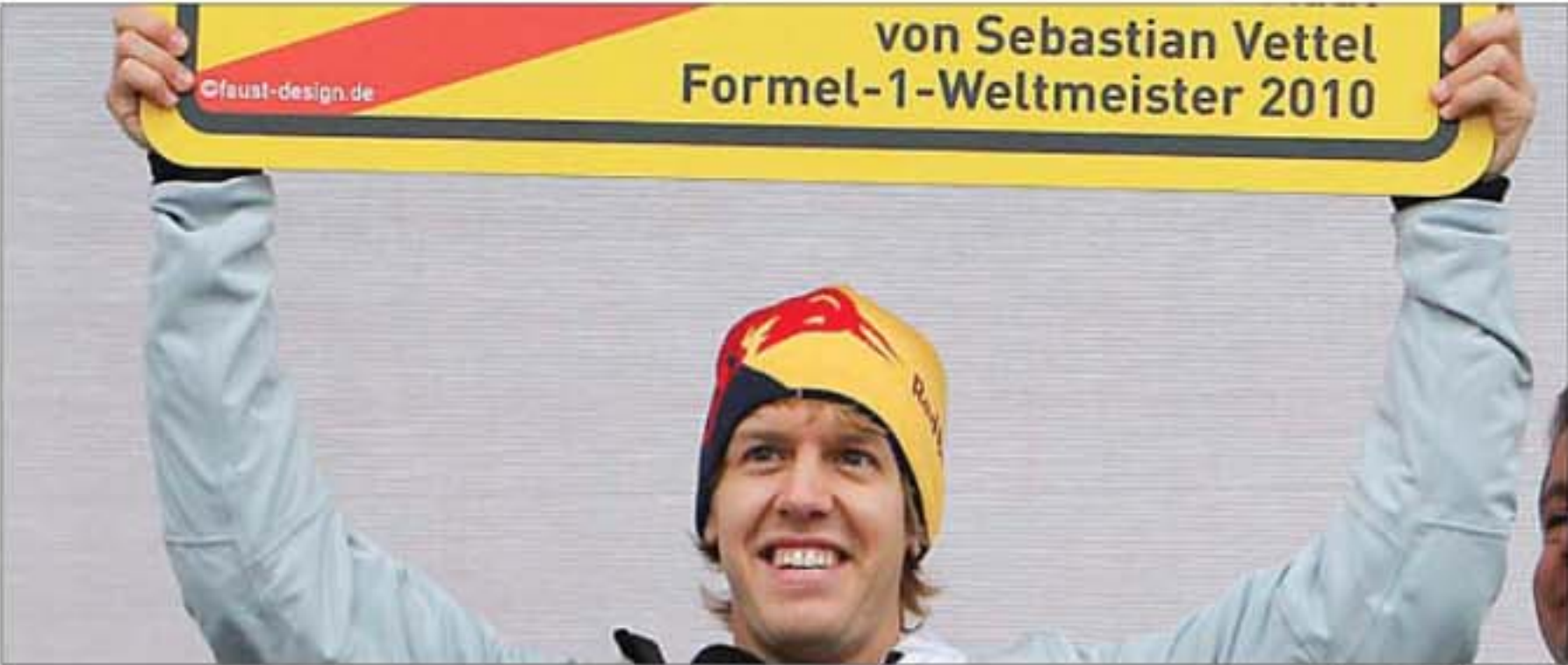
von Sebastian Vettel Formel-1-Weltmeister 2010