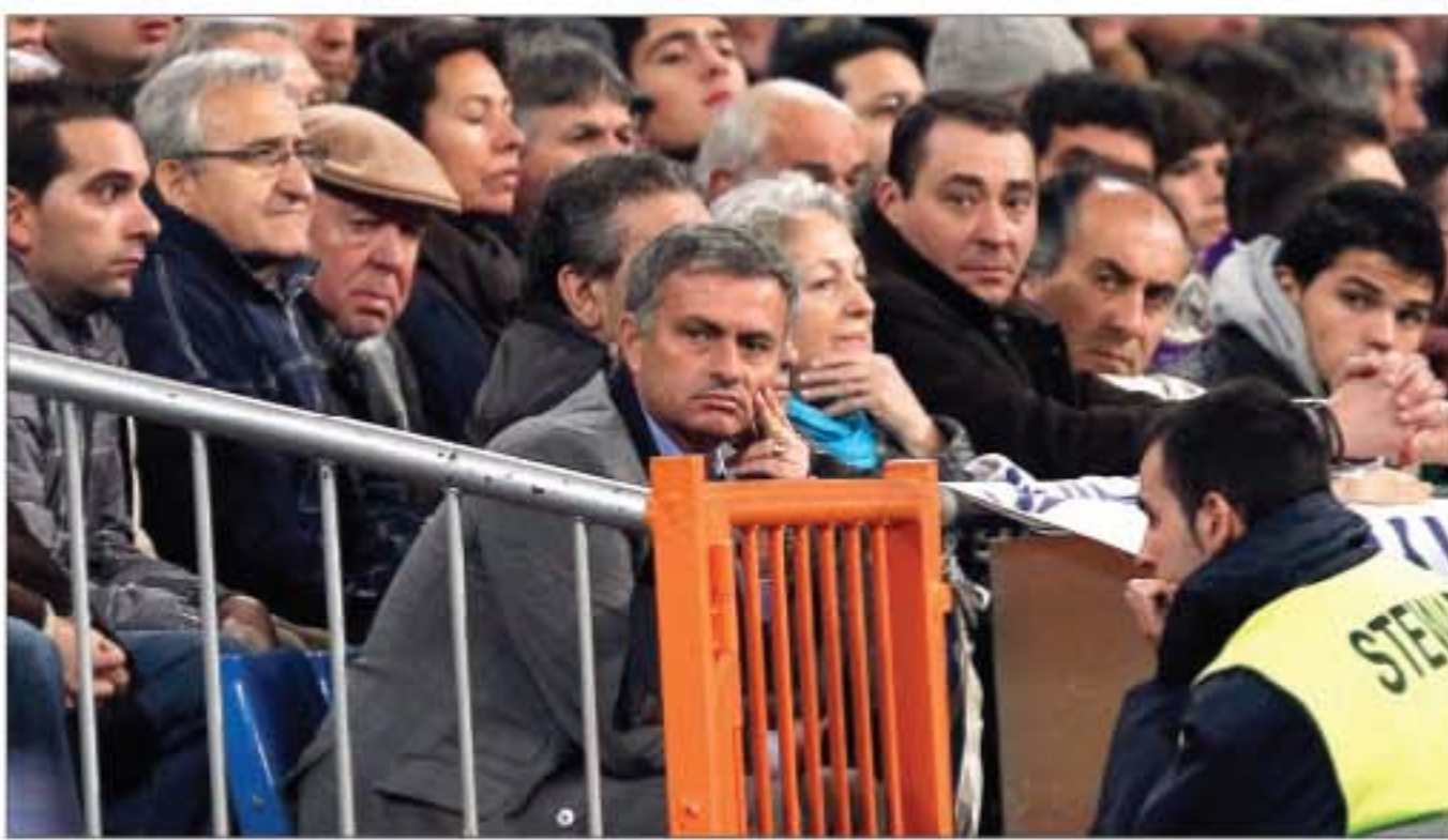
MENIKMATI SANKSI: Pelatih Real Madrid Jose Mourinho duduk berburau dengan penonton saat pertandingan melawan Athletic Bilbao kemarin.