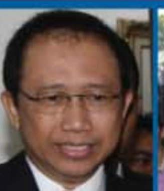
Marzuki Ali, Ketua DPR RI