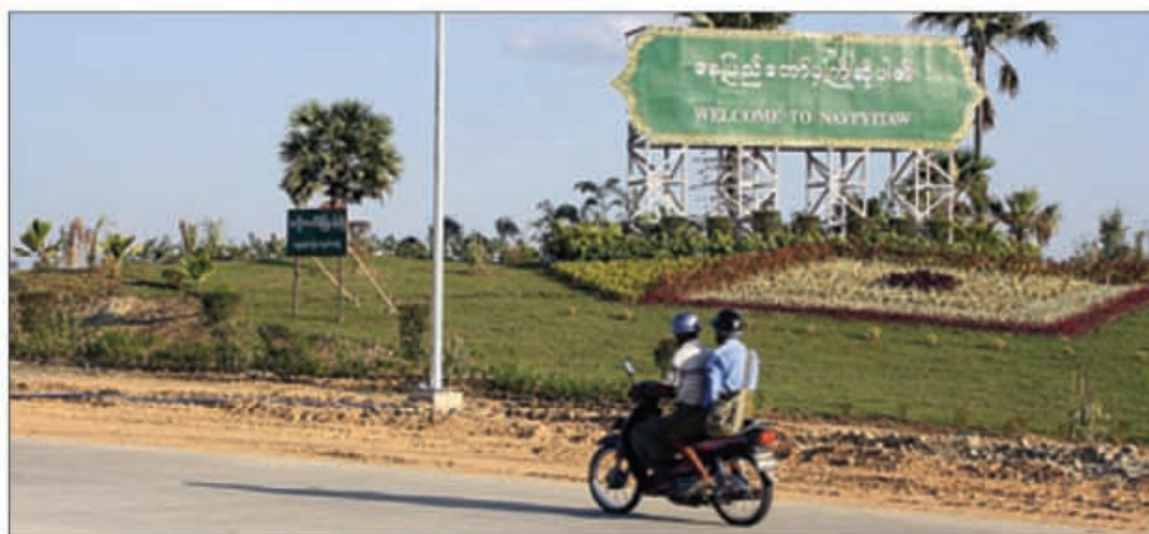
ISTANA KERAJAAN: Pintu gerbang Kota Naypyitaw, ibu kota Myanmar, yang baru. Pagoda Uppasanti yang sering disebut sebagai replika Pagoda Shwedagon (foto kiri).

lanan di Yangon tidak pernah macet. Apalagi, Yangon, kota terbesar di Myanmar, terlarang bagi motor.