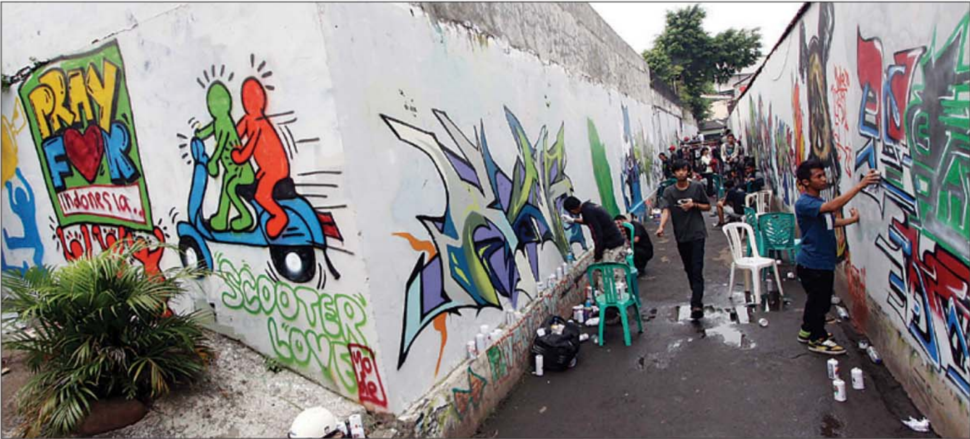
UKON FURKON SUKANDA INDOPOS