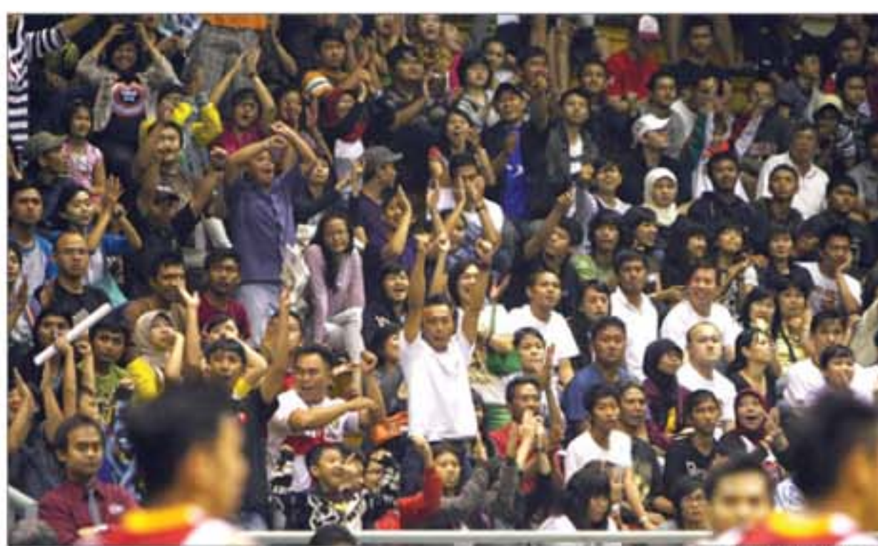
HENORA EKAJAWA POS

Kesan baik tak hanya dirasakan para penonton biasa. Jajaran selebriti juga ter-