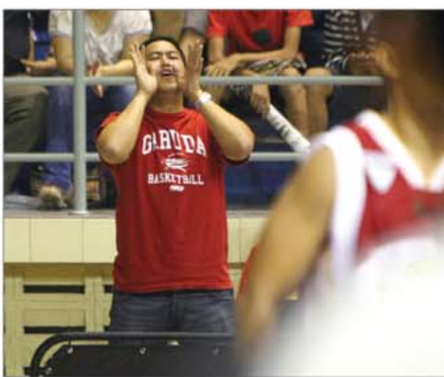
FANATIK: Selebritis Pandji Pragiwaksono saat mendukung Garuda kemarin (foto kiri). Penonton memenuhi C-Tra Arena.

pertandingan yang dikemas NBL. Fina Dewanti juga kembali bergairah untuk menyaksikan kompetisi basket. Selain kualitas pertandingan, dia merasa betah karena tak ada asap rokok di lapangan. NBL Indonesia memang tak memperbolehkan penonton merokok di arena pertandingan. Itu tidak lepas dari kebijakan NBL yang tidak menggandeng sponsor rokok.