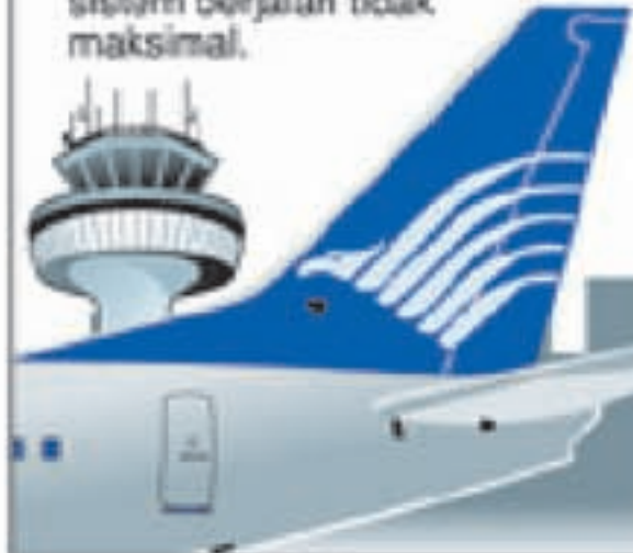
GRAFIS: HENI OWELANDPOS

Kali pertama mengoperasikan sistem monitor baru. Yakni, monitor 580 pilot, 2.000 awak kabin, dan 2.000 jadwal penerbangan. Perubahan sistem berjalan tidak maksimal.