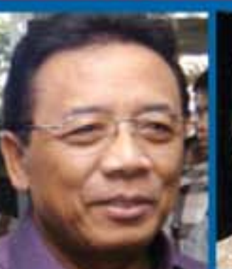
Djoko Suyanto, Menko Polhukam