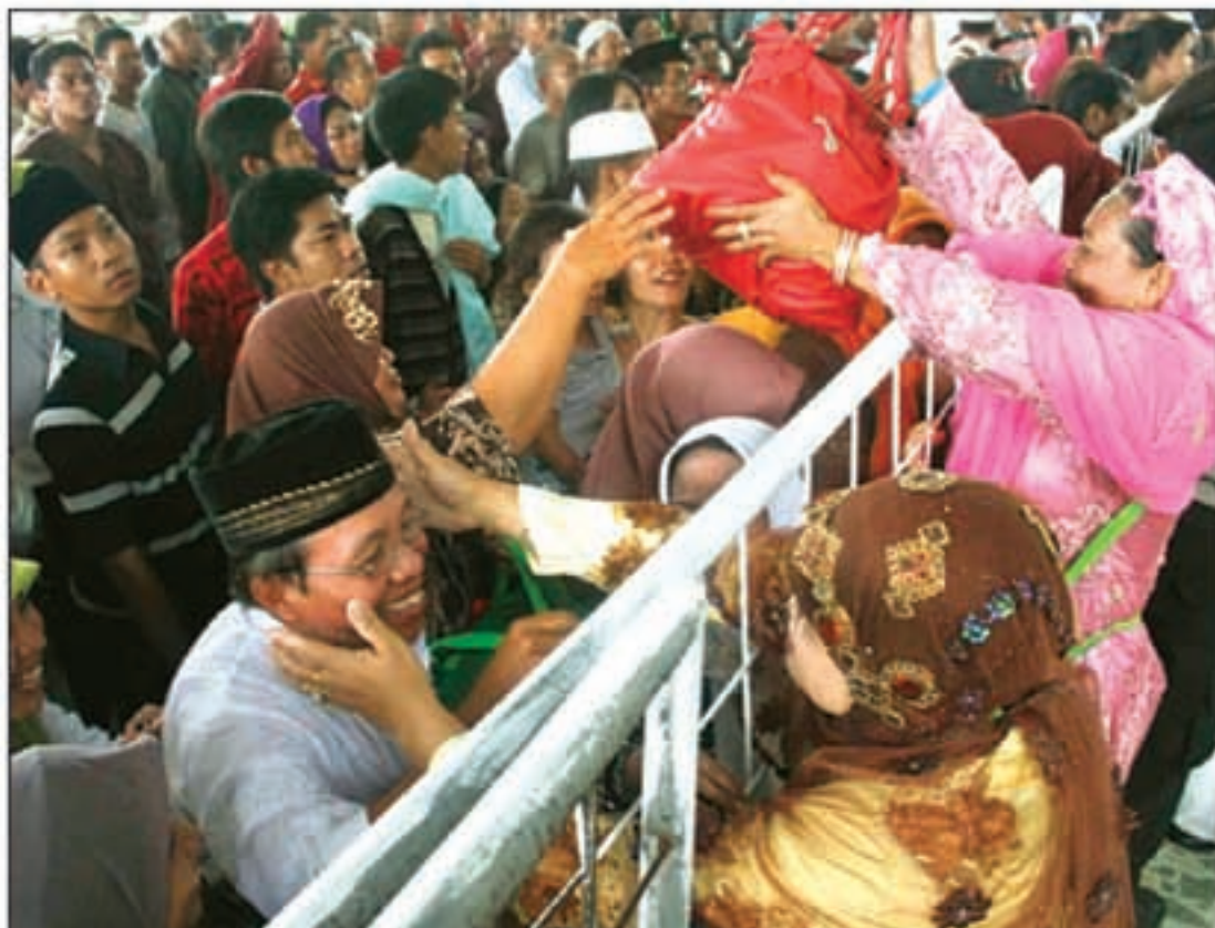
KLOTER PERTAMA: Jamaah haji tiba di Bandara Hasanuddin.