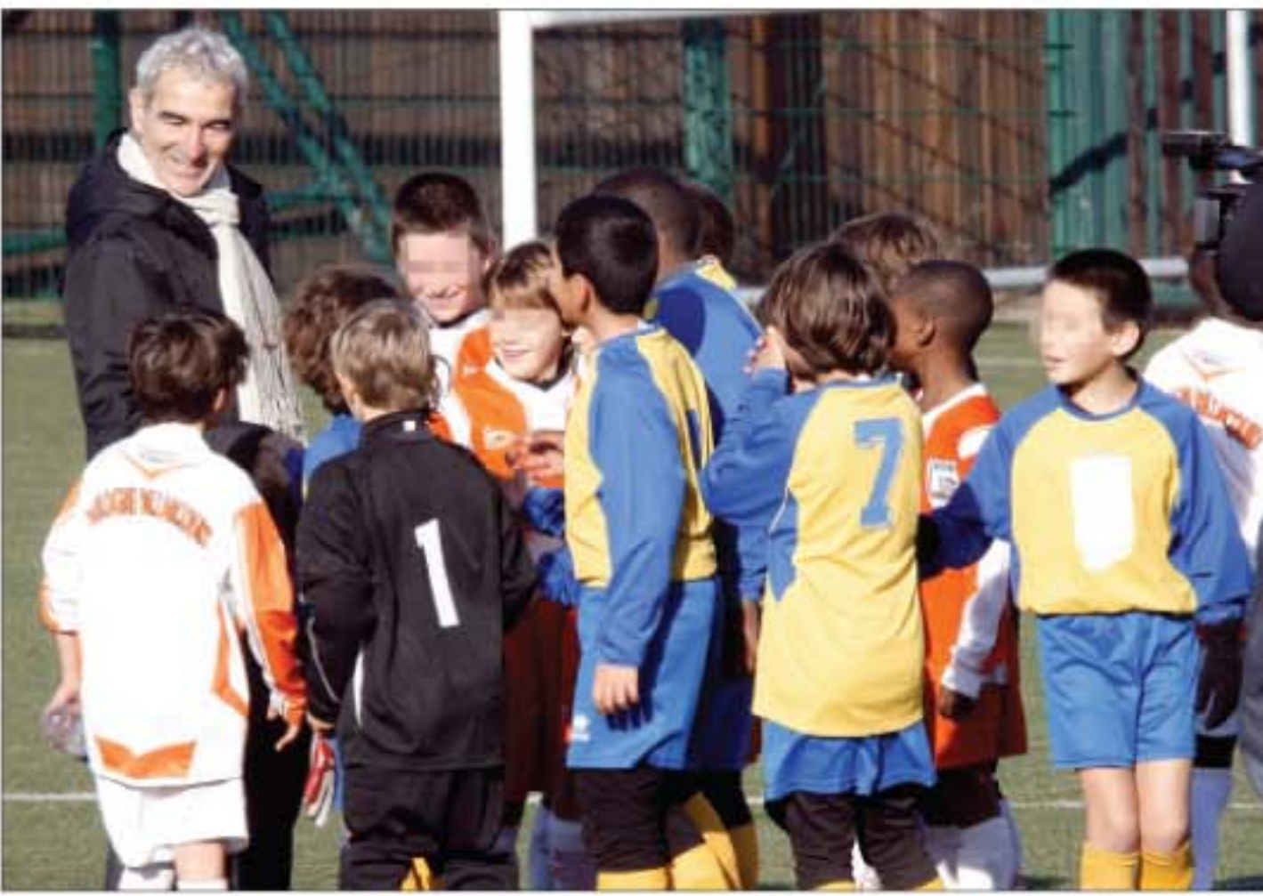
SEKADAR HIBURAN: Raymond Domenech (kiri) bersama anak didiknya dari Boulogne-Billancourt, Paris, kemarin (21/11).

Setelah lengser, dia tidak pernah dikabarkan melatih tim lain. Baik timnas maupun klub. Pelatih 58 tahun itu justru sibuk menuntut kompensasi aki-