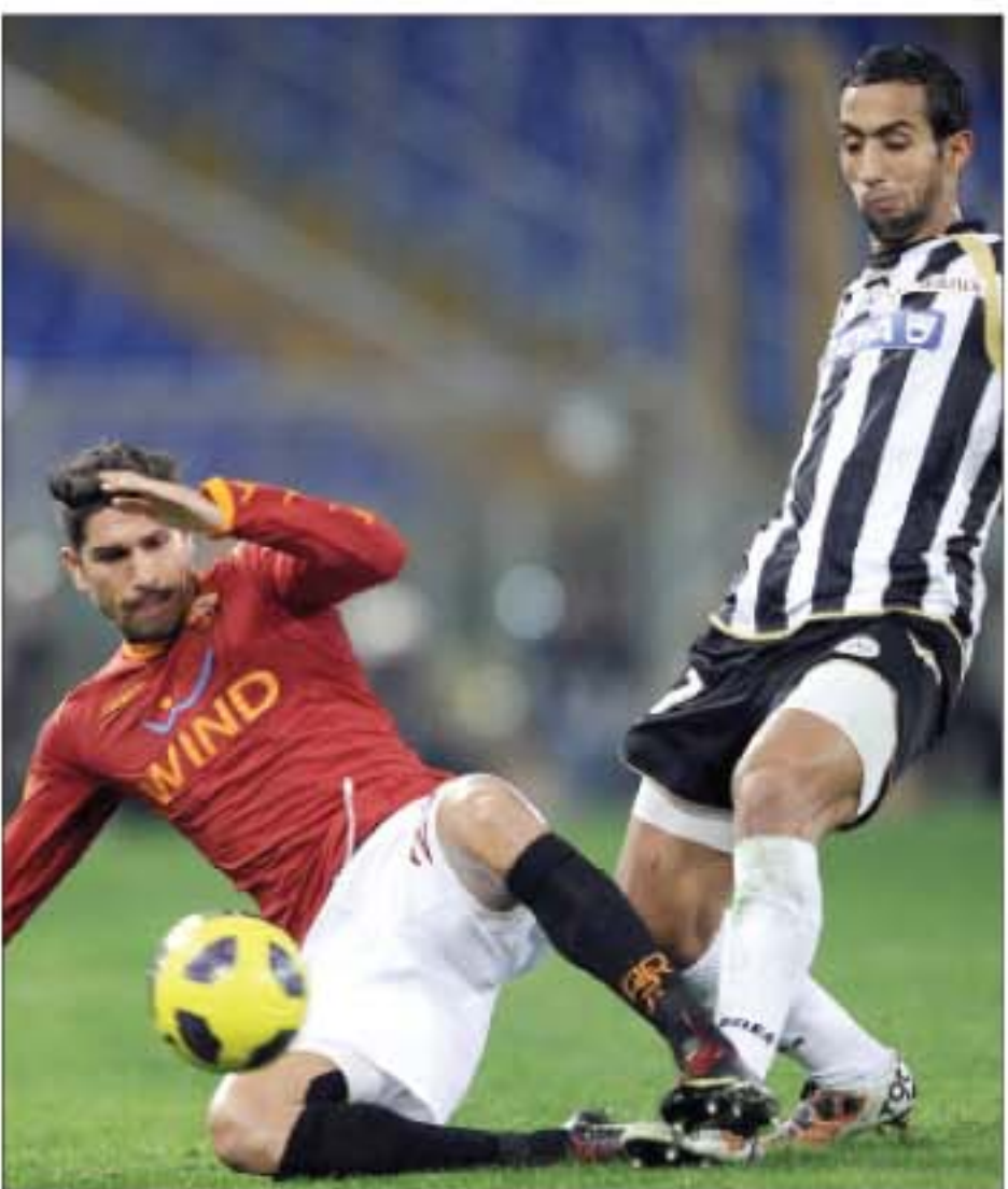
BELUM TERBENDUNG: Marco Borriello (kiri) merebut bola dari kaki Alexis Alejandro Sanchez.

Jadwal tayangan bisa berubah sewaktu-waktu sesuai kebijakan stasiun televisi yang bersangkutan