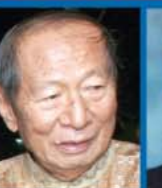
Ir Ciputra, Pengusaha