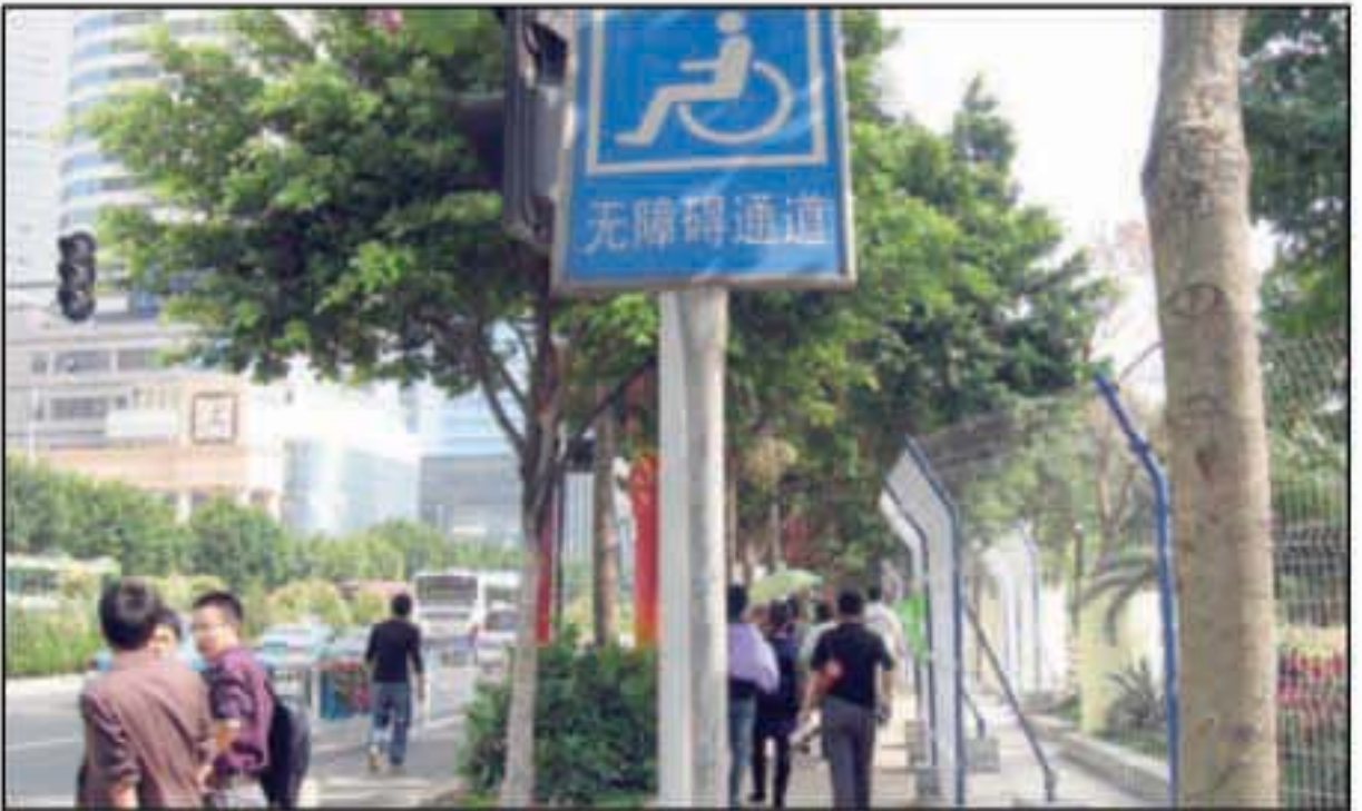
BERTEBARAN: Pemerintah menyediakan jalur bagi mereka yang kurang beruntung.

Guangzhou yang merupakan ibu kota Provinsi Guangdong merupakan pusat kegiatan politik dan ekonomi dengan kehidupan yang cukup tinggi. Pertumbuhan ekonomi Guangzhou pada 2009 mencapai 12 persen dengan nilai RMB 270 miliar, lebih tinggi dibandingkan