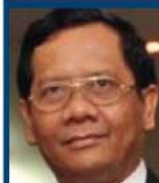
Profesor Dr Muh Maftud MD, SH, SU, Ketua Mahkamah Konstitusi