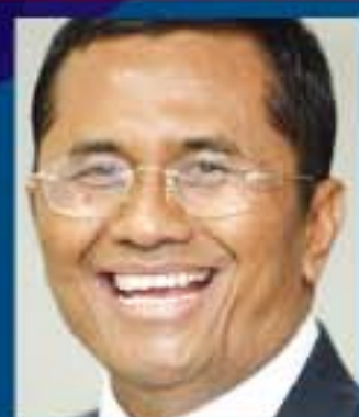
Dahlan Iskan, Direktur Utama PLN