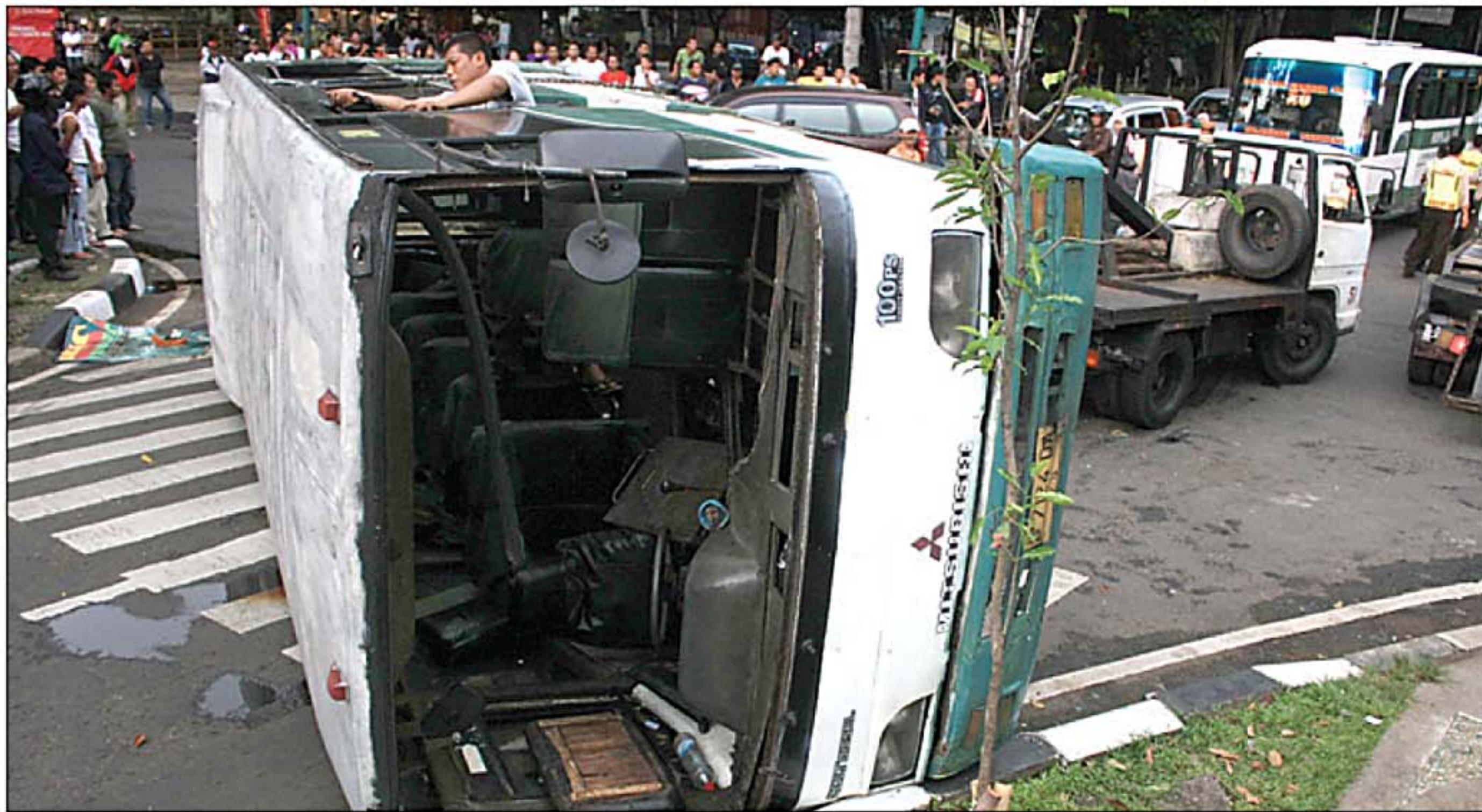
UKOH FURKON SUKANDA INDOPOS

Tapi nyatanya pengelolaan limbah di sepanjang Kali Malang diduga mencemari air. "Selain itu juga dilarang membuang atau membakar limbah disembarang tempat. Tapi ini tidak diindahkan," ungkapnya juga. "Karena ini menyangkut institusi lain jadi BPLHD tidak bisa bergerak sendiri," cetusnya. (dai)